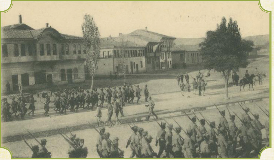
Yunan askerlerinin Eskişehir'e girişı (1921)